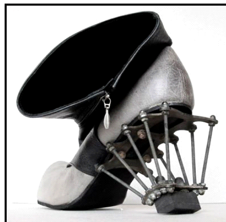
FIGUUR B: Skoen deur Kei Kagami, Japannees Londen-gebaseerd, Dekonstruksie (Brittanje), 2012.

4.2.1 Noem EEN ander ontwerper en ontwerpproduk van die Art Deco-beweging en die Dekonstruksie-beweging.