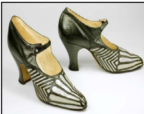
FIGUUR A: Starburst-skoen deur T de Bont, Art Deco (Nederland), 1922.