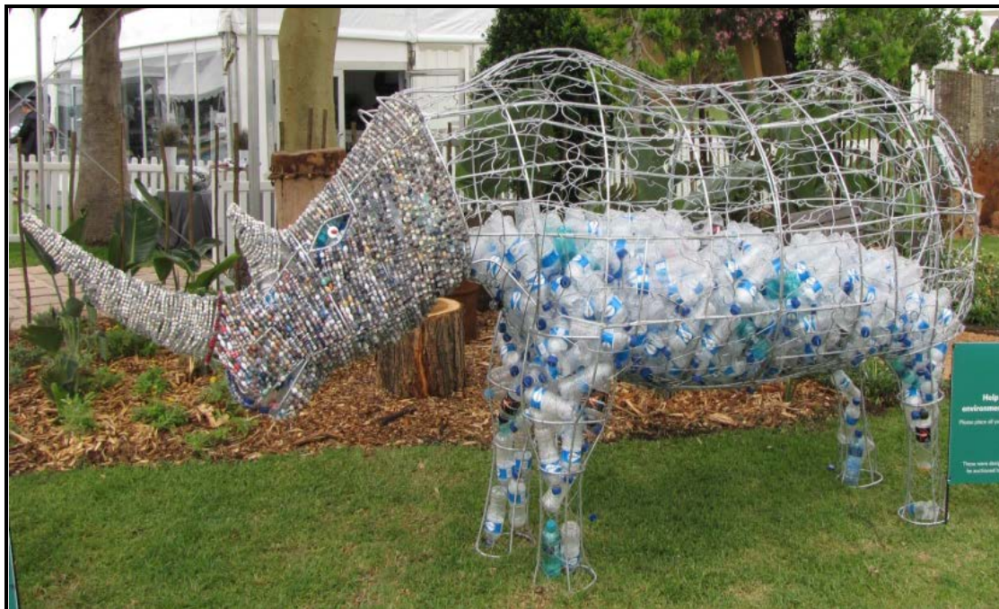
FIGUUR A: Renoster deur plaaslike handwerkkunstenaars wat draadhangers/krale/plastiekbottels gebruik (Pilanesberg, Suid-Afrika), 2012.

6.1.1 Wat is die doel van volhoubare ontwerp? (2)