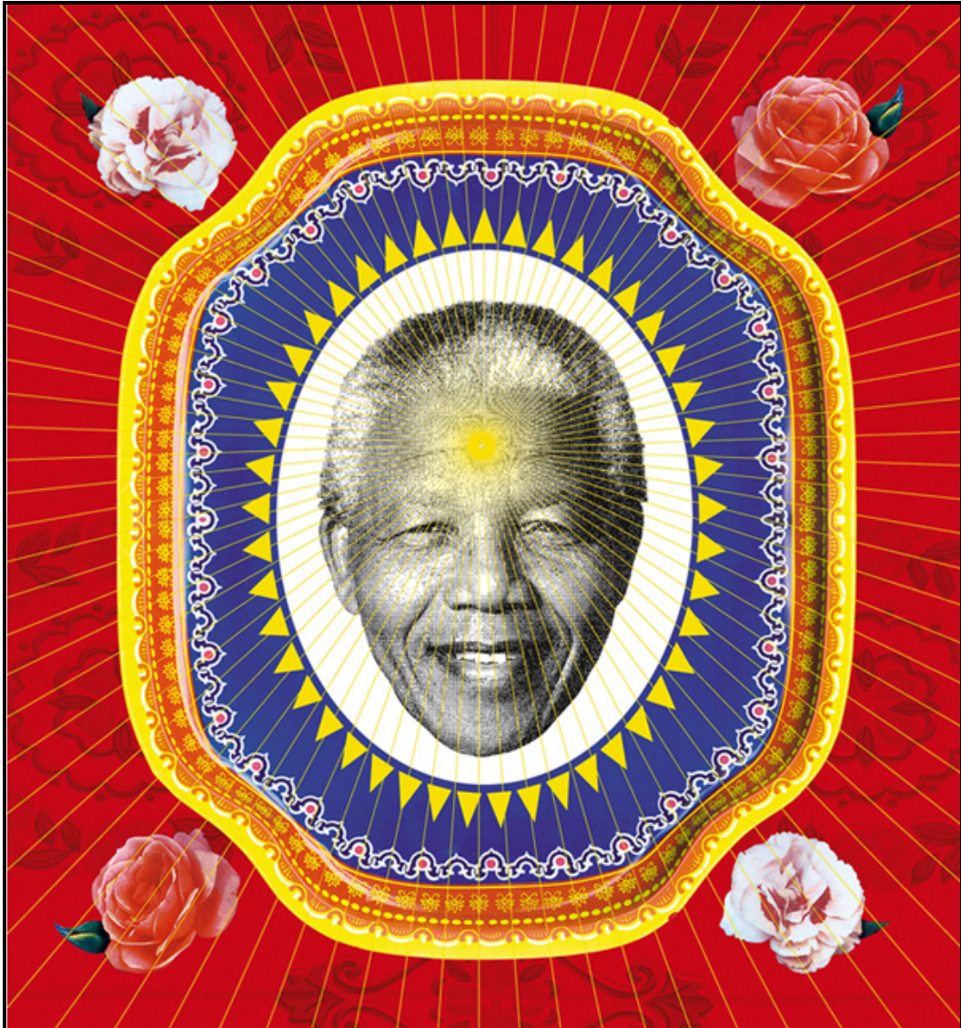
FIGUUR A: Mandela plakkaat deur Garth Walker (Mandela Plakkaatprojek-versameling) (Suid-Afrika), 2013.

1.2.1 Bespreek hoe die ontwerper 'n fokuspunt in FIGUUR A geskep het. (2)