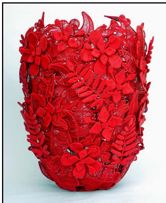
FIGUUR A: Zenzulu Wire Natuurrooi Houer deur Marisa Fick-Jordaan (Suid-Afrika), 2010.

Die ontwerper van die houer in FIGUUR A hierbo gebruik tradisionele kunshandwerktegnieke/-materiale op 'n moderne manier en bemagtig terselfdertyd individue of gemeenskappe. Skryf 'n opstel (van ten minste EEN volle bladsy) oor enige EEN kontemporêre Suid-Afrikaanse ontwerper/ontwerpgroep.