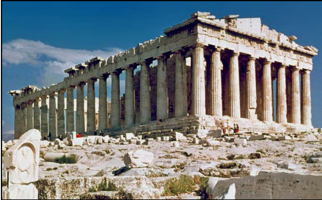
FIGUUR A: Die Parthenon (Athene, Griekeland), c. 432 VHJ.

Skryf 'n opstel (van ten minste EEN volle bladsy) waarin jy die klassieke gebou in FIGUUR A hierbo – of enige ander klassieke gebou wat jy bestudeer het – met enige kontemporêre gebou wat jy bestudeer het, vergelyk.