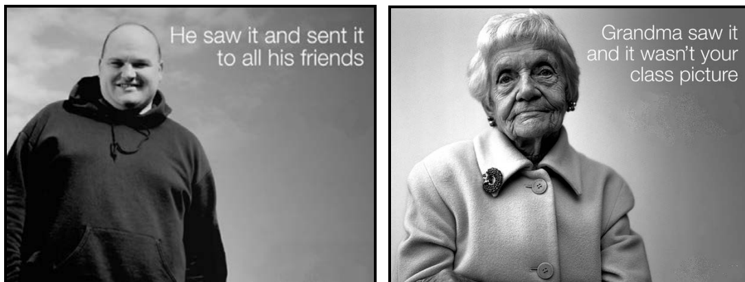
FIGUUR A: Kuberafknoery-veldtog deur PSA (VSA), 2013.

Die misbruik van persoonlike beelde deur verskeie mediaplatforms wat in die veldtog hierbo getoon word, beklemtoon dat 48% van die halfnaak- en naakfoto's wat deur 13–17-jariges as teksboodskappe deur middel van 'n selfoon gestuur word, in die hande van die verkeerde persoon beland het.