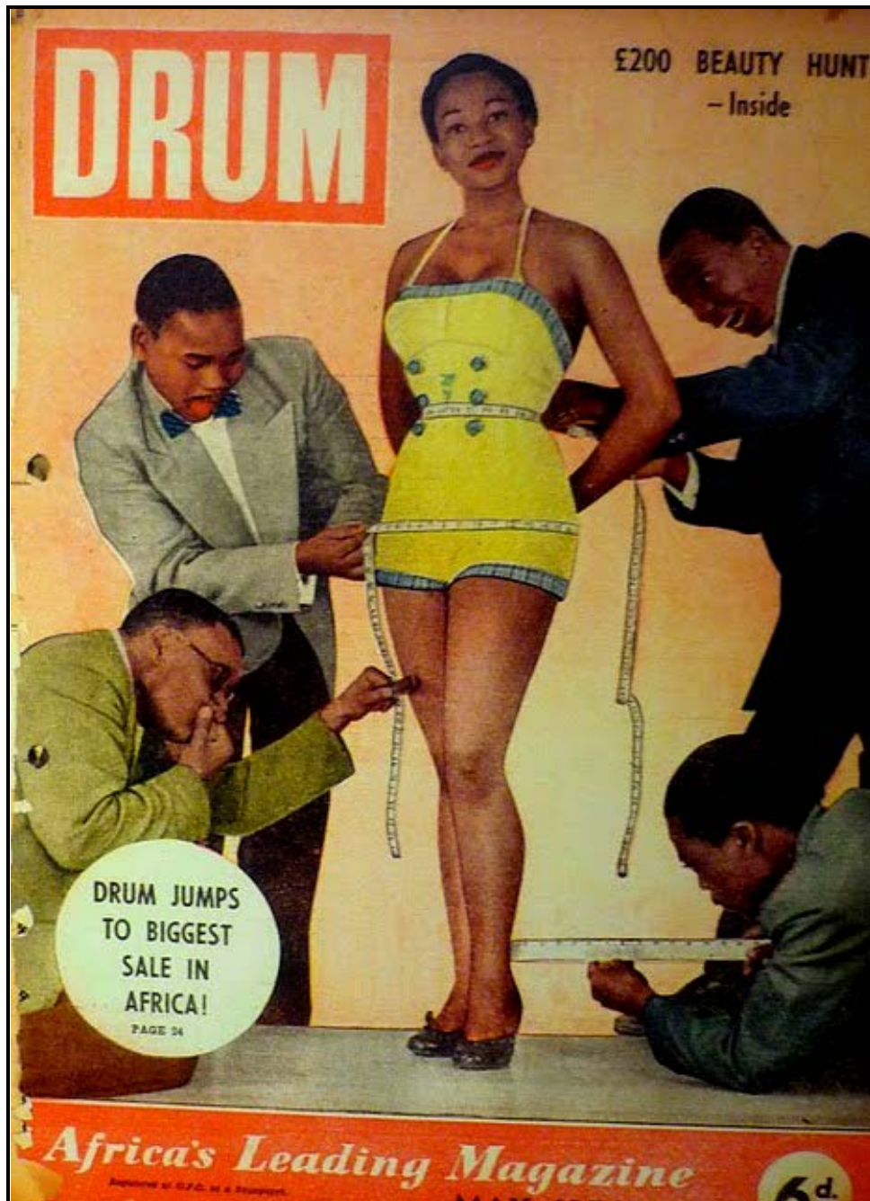
FIGUUR A: Drum-tydskrif-voorblad (Johannesburg, Suid-Afrika), 1956.