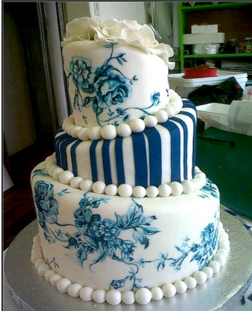
FIGUUR A: Troukoek deur Charly's Bakkery (Kaapstad), 2012.

1.1.1 Analiseer en bespreek die gebruik van die volgende met betrekking tot FIGUUR A hierbo: