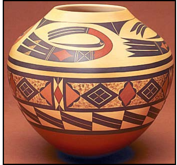
FIGUUR B: Hopi-pot deur Steve Lucas, (Amasone-canyon, VSA), 2004.

Vergelyk FIGUUR A met FIGUUR B hierbo in 'n opstel (van ten minste EEN volle bladsy) deur ooreenkomste en verskille te bespreek met verwysing na: