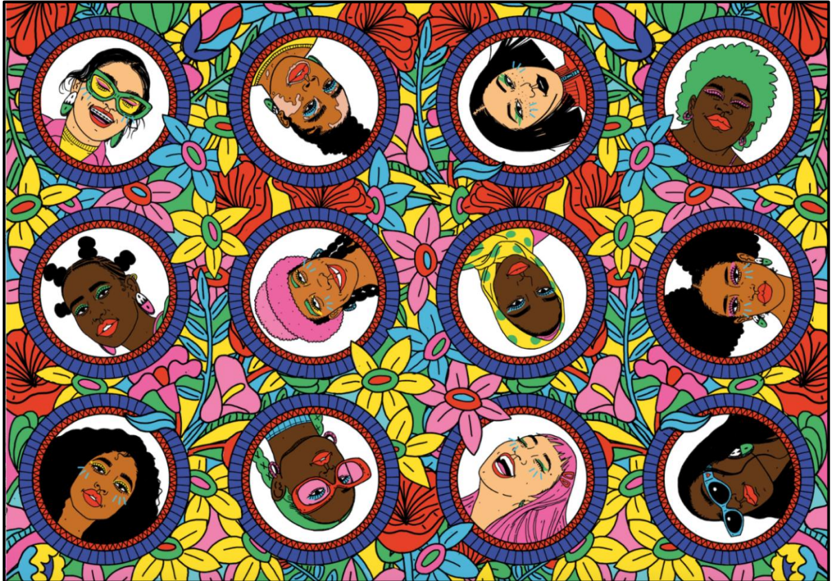
FIGUUR A: Oppervlakontwerp deur Zinhle Sithebe (Suid-Afrika), 2020.

1.1.1 Analiseer die gebruik van die volgende elemente en beginsels in FIGUUR A hierbo: