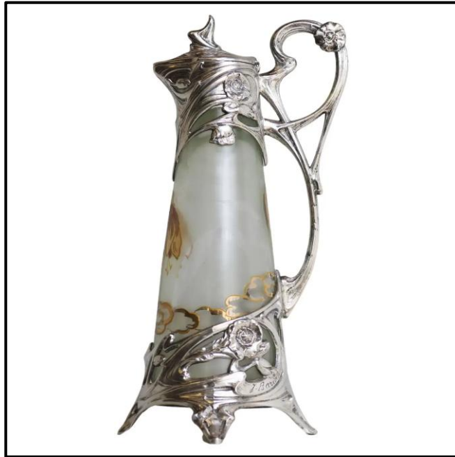
FIGUUR H: Art Nouveau-kraffie deur J Borian (Frankryk), 1900's.