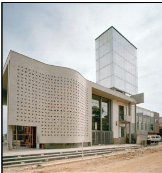
FIGUUR G: Die Konstitusionele Hof deur Urban Solutions and OMM Design Workshop (Suid-Afrika), 1996.