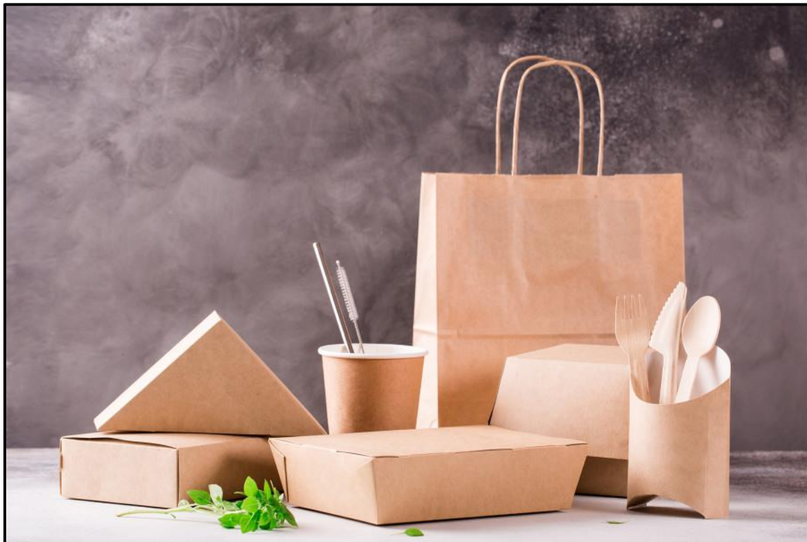
FIGUUR K: Ekovriendelike verpakking deur Viro Solutions (Suid-Afrika), 2019.

6.1.1 Bespreek waarom die verpakking in FIGUUR K ekovriendelik is. (2)