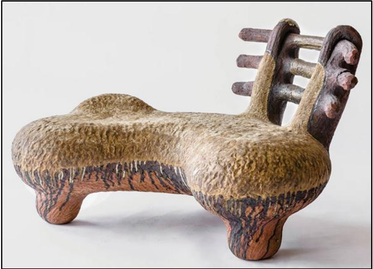
FIGUUR B: uBuhlanti (Kraal)-bank deur Andile Dyalvane (Suid-Afrika), 2020.

Analiseer die gebruik van die volgende terme ten opsigte van hulle gebruik in FIGUUR B hierbo: