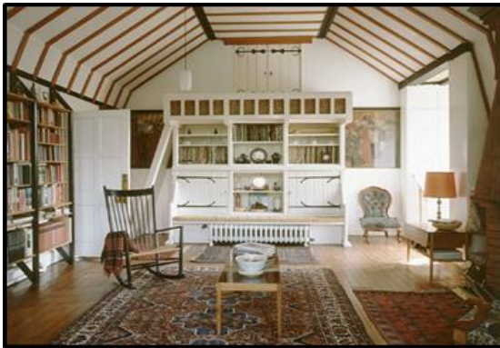
Kuns en Kunsvlyt